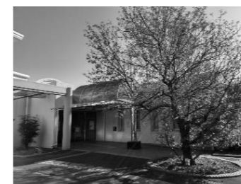
藤が丘地区センター (1月)

藤が丘地区センターにお正月前後に桜の花を咲かせる「ヒマラヤ桜」という木がある。今年も年明け早々に見に行ったが、すでに葉桜になっていた。 「散ってしまいましたね。」と、私と同じ年くらいの女性が話しかけてきた。その方は孫も大きくなり、暇な時に折り紙を楽しんでいるという。 『後期高齢者』というレッテルを貼られてから、なんとなく落ち込んでいる私の気持ちを察したのか、私の手に手作りのお雛さまを乗せ「後期は幸期よ」と笑顔で去っていった。私の心に一足早く暖かい春の風が吹いたようでした。