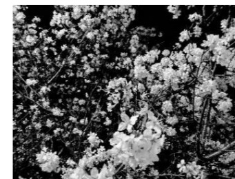
ヒマラヤザクラ (12月上旬)

上記に関わらず、症状が重い、徐々に悪化している等、緊急の場合は 119 *横浜市ホームページより